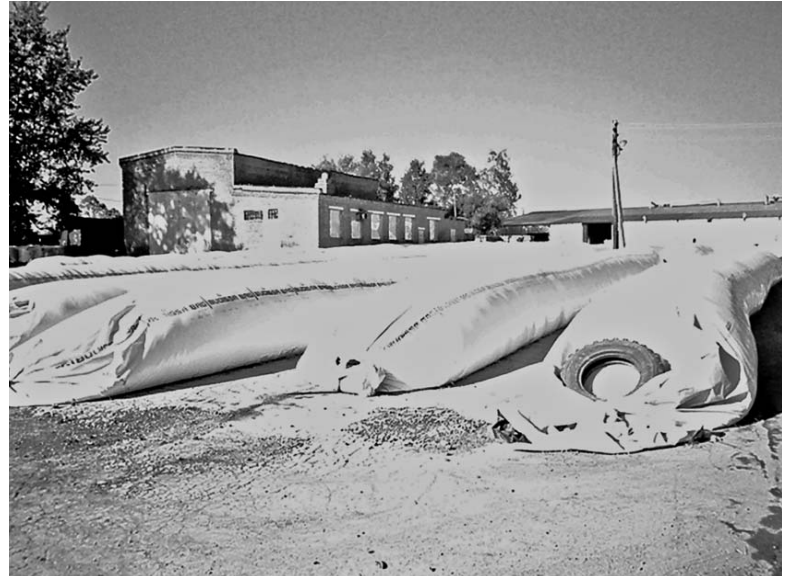
Плющенное зерно хранится надежно.

очень хорошо, что ее у нас занимает специалист своего дела