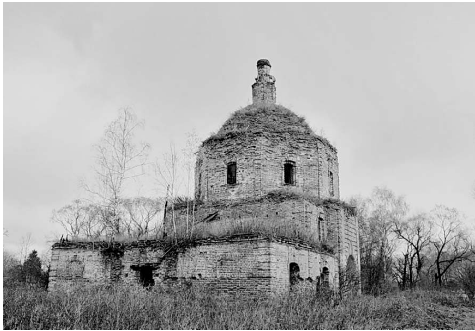
255 лет назад (1759 г.) в с. Извеково была построена каменная церковь на месте деревянной во имя Божией Матери «Одигитрия».

нинской тоже имели возраст около трех сотен лет. Церковь в с. Мезенцево поставлена в 1696 г., а в с. Лычине – в 1700 г. Дата постройки многих других бабынинских храмов остается неизвестной.