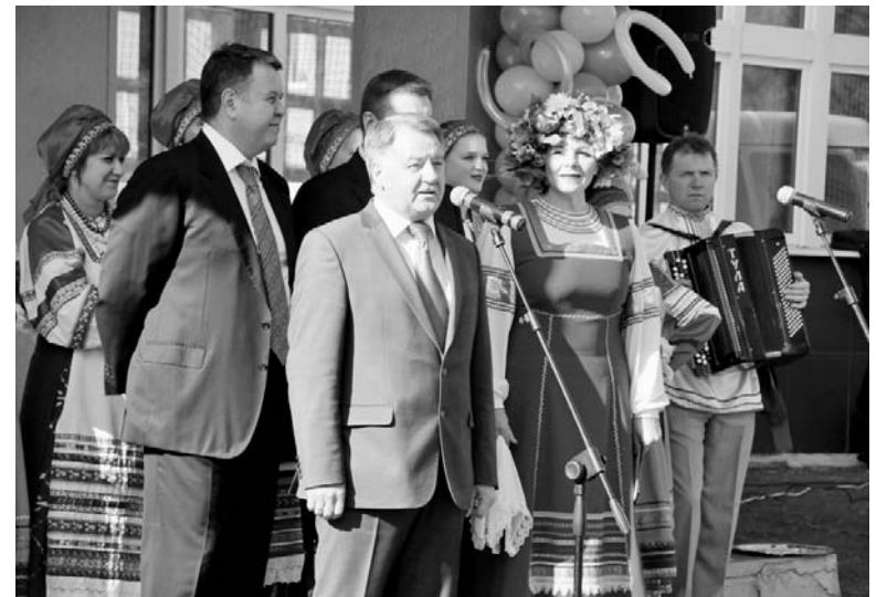
Министерство внутренней политики и массовых коммуникаций Калужской области.

Выставка-ярмарка в Анненках продлится до 21 сентября. В ее программе – презентации участников, дегустация продуктов питания, выступления районных коллективов художественной самодеятельности. Здесь же состоится областной конкурс качества продуктов питания калужских перерабатывающих предприятий, а также смотр-конкурс «Покупаем Калужское».